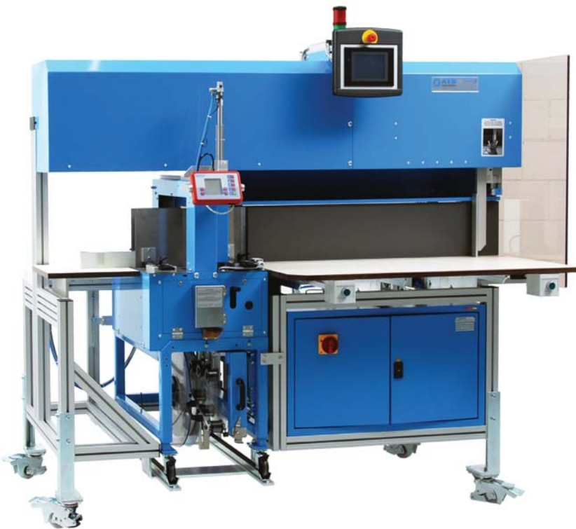
Ausführung links Construction left