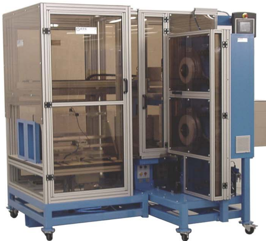
Transit mit automatischem Bandwechsler Transit with automatic band changer