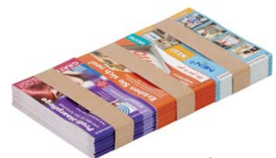
Dreifachnutzen / three-up

Die US-2000 TRS-SLM übernimmt die Produktstapel (1-fach bis 3-fach Nutzen) nach dem Kreuzleger auf dem Shuttleworth und das Servo-Handling-System schiebt die Stapel in die Banderoliermaschine. Vor dem Banderolieren werden die Stapel an allen vier Seiten ausgerichtet. Die Leistung beträgt bis zu 24 Banderolierungen pro Minute.