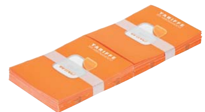
Zweifachnutzen / two-up