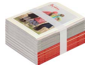
Einfachnutzen / one-up